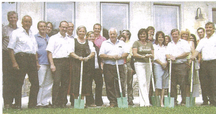
Mit vereinten Kräften wurde der Spatenstich vorgenommen.

Derzeit sind noch Überlegungen im Gange, ob man den Schulbetrieb während der Bauphase aus Sicherheitsgründen nicht in Räumlichkeiten des Gemeindeamtes verlegen kann.