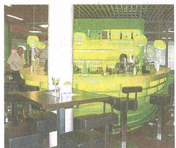
Liebe zum Detail: Außen und innen gleicht das Haus einem Schiff